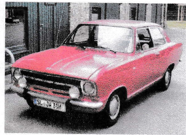
Opel Kadett 1972